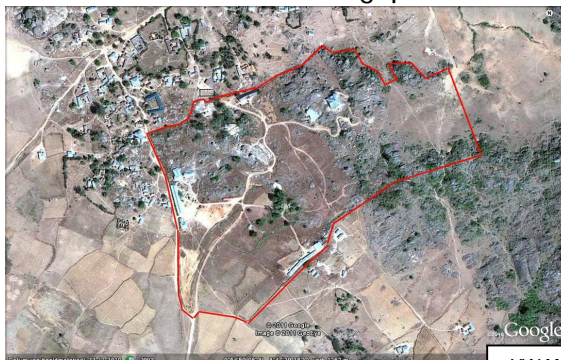
YWAM campus 'City of Refuge'

Fulanies hebben regelmatig geprobeerd om met hun koeien de plantage binnen te dringen, en 2 januari hebben ze zelfs een deel in de brand gestoken. Gelukkig wisten de medewerkers het vuur snel genoeg onder controle te krijgen. Omdat de twee jongens ook regelmatig bedreigd