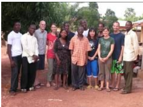
Our outreach team together with the people of the new YWAM location in Otukpo.

After receiving and changing myself, in the outreach it was time to teach