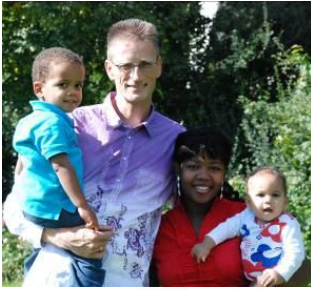
Bekend te maken...