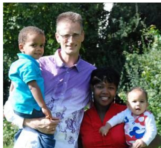
bekend te maken...